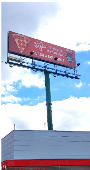
Foto 2. Vista del panel orientación SUR - NORTE y de la estructura de la valla, en buenas condiciones y estable.